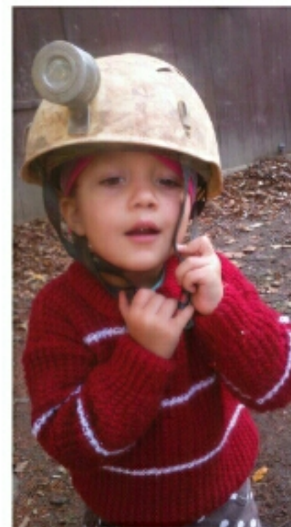
jeskyně Býčí skála